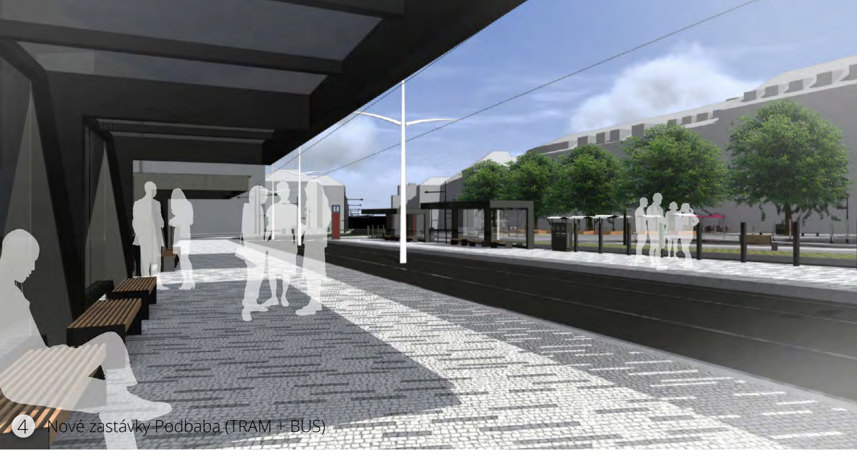
4 Nová zastávka Podbaba (tramvaj, autobus)