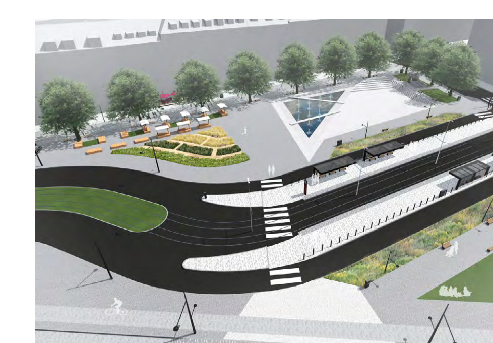
10 Nová zastávka Podbaba