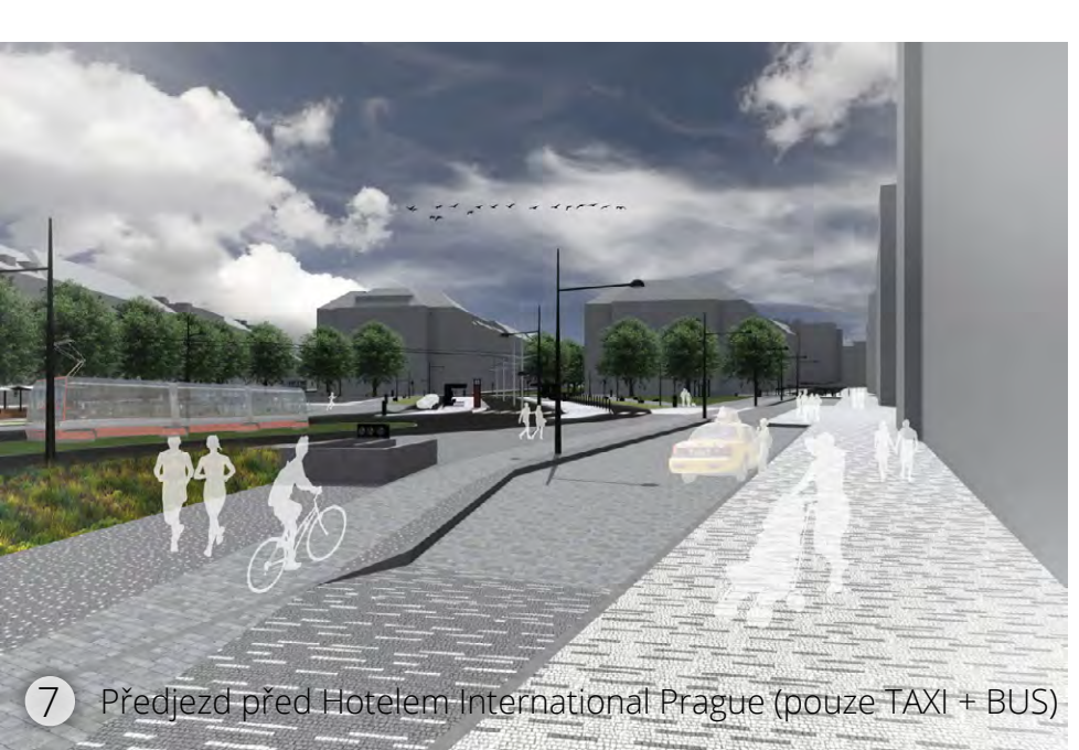
7 Přechod před Hotel International Prague (buss, TAXI)