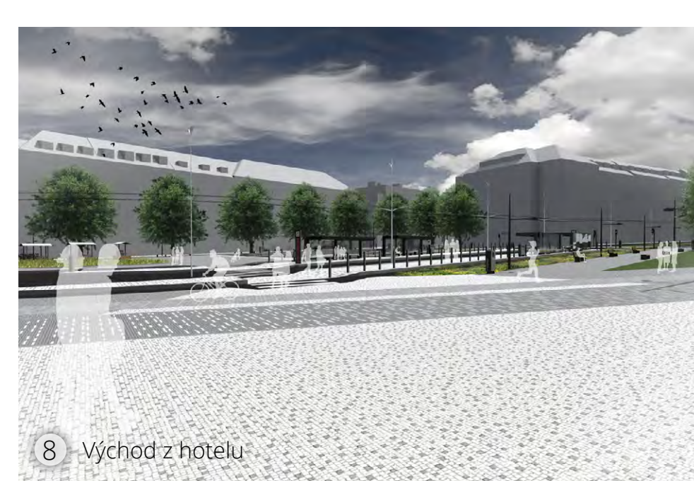
8 Východ z hotelu