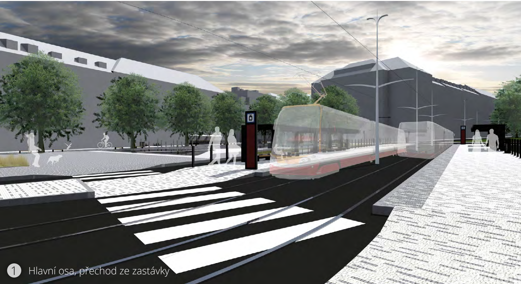
1 Hlavní osa přechodu ze zastávky

Garáže nabízejí celkem 351 parkovacích stání. Většina parkovacích míst na povrchu bude zrušena (parkoviště uprostřed hlavního prostoru celé, podélná stání budou částečně zrušena a částečně zachována a kolmá stání zrušena) a jako alternativa vzniknou právě tyto garáže.