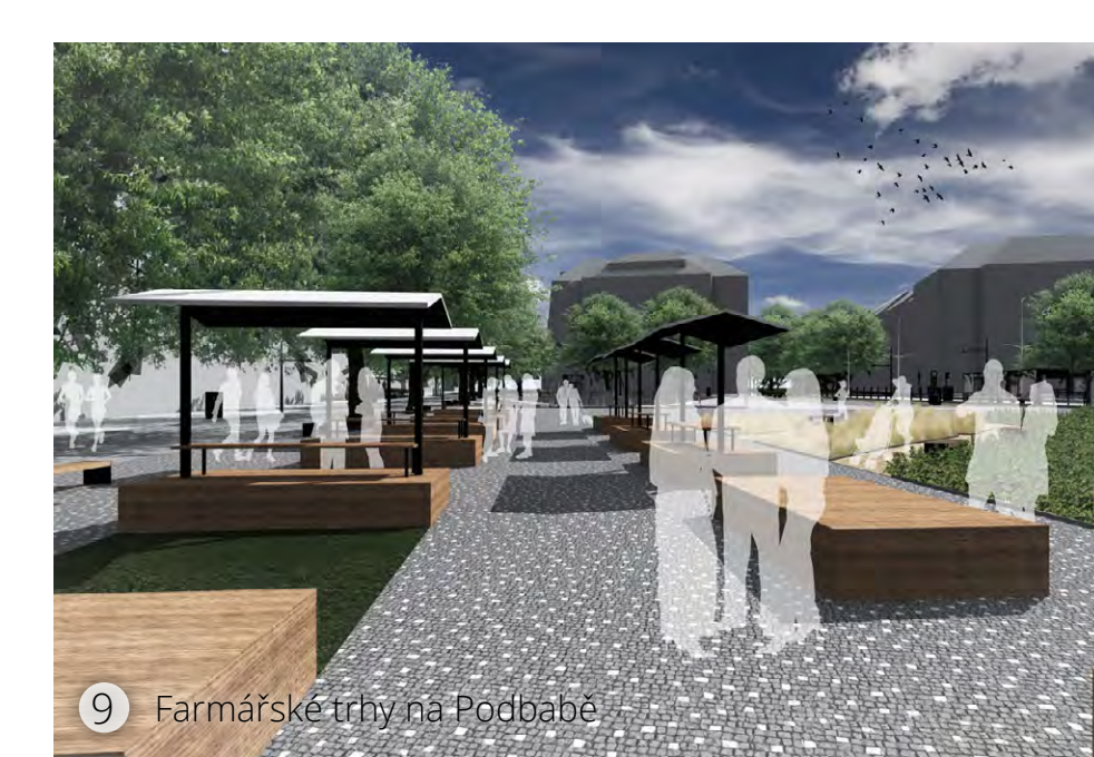
9 Farmářský trh na podlaží