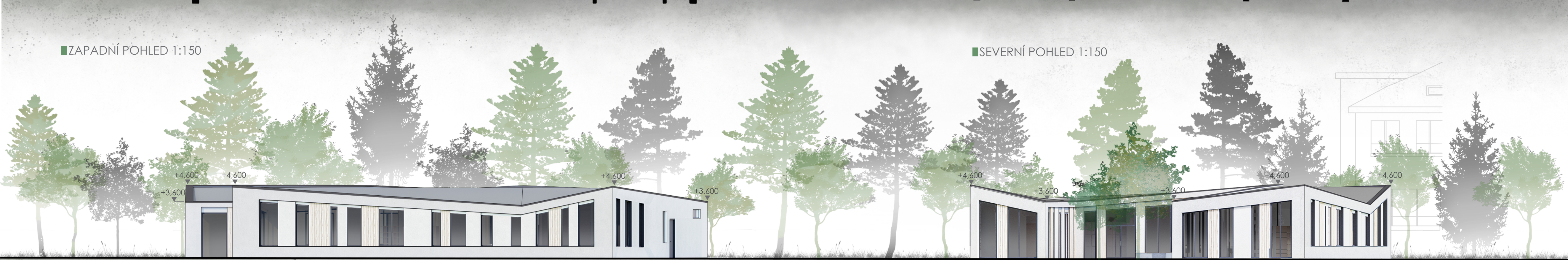
SEVERNÍ POHLED 1:150