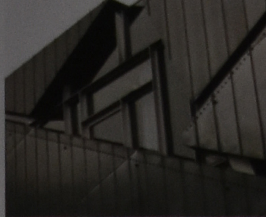
Detail fasády Židovského muzea Berlin