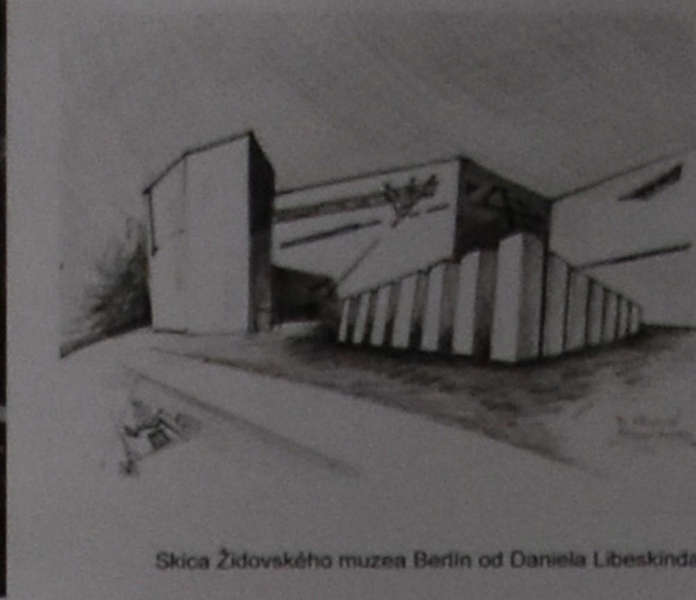
Skica Židovského muzea Berlin od Daniela Libeskinda