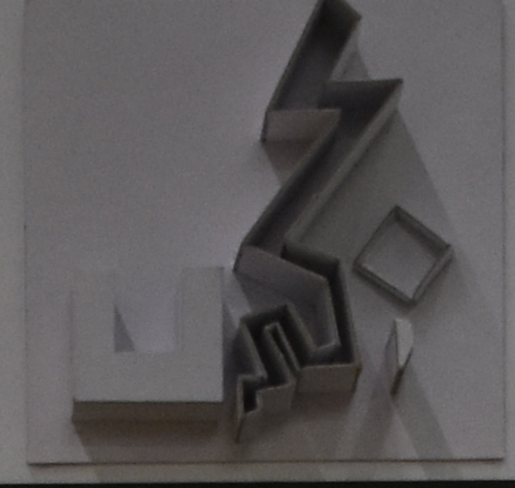
Židovské muzeum Berlin (2001) Daniel Libeskind Berlin, Německo

Koncept stavby přesně odpovídá obsahu stavby. Jedná se o Dovu hvězdu, která byla různě natahována a ohybána. Budova samo o sobě působí na lidské vnímání, a proto byla otevřena roky bez expozice.