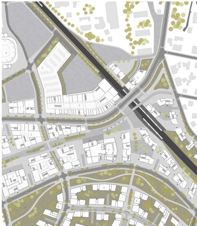
1. letištní terminál | 2. nádraží | 3. obchody | 4. kulturní centrum | 5. P+R | 6. městský park | 7. kanceláře | 8. bydlení | 9. sportovní parter