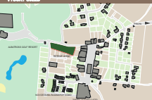
ANALÝZA ŠIRŠÍCH VZTAHŮ 1:2500

Na žádost investora měla vzniknout budova pro trenažéry v blízkosti hlavního golfového areálu Albatros, sloužící hlavně pro zimní hru a začátečníky. Návrh byl upraven tak, aby co nejméně zatěžoval místní obyvatel a nekomplikoval dopravní situaci. Zahnuje kavárnu s posezením venku, golfový obchod s recepcí, možnost volitelných jamek a trénování puttování na několika venkovních greenech, které doplňují terénní nerovnosti. Vnitřní tréninkový prostor se skládá z 6 virtuálních odpalů s vlastním posezením a jednoho virtuálního greenu. Indoor trenažéry s občerstvením a recepcí, která umožňuje i úschovu bagů, nabízí pocit soukromí a protější pro nerušenou hru. Návrh využívá přírodní materiály a je letný k přírodě. Střecha je z dřevěné konstrukce; křivky, které ji tvoří, dávají celé stavbě dynamiku.