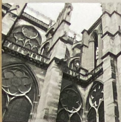
BAZILIKA SAINT-DENIS (Saint-Denis, Francie)

Eugène Viollet-le-Duc řídil projekt navrácení hradek a Muzea francouzských památek zpět do krypty v Saint-Denis.