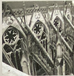
KATEDRÁLA NOTRE-DAME (AMIENS, FRANCIE)

Viollet-le-Duc v 19. století doplnil vrchní část fasády - uvedení do původního stavu před rokem 1193 (částečná demolice během Velké francouzské revoluce).