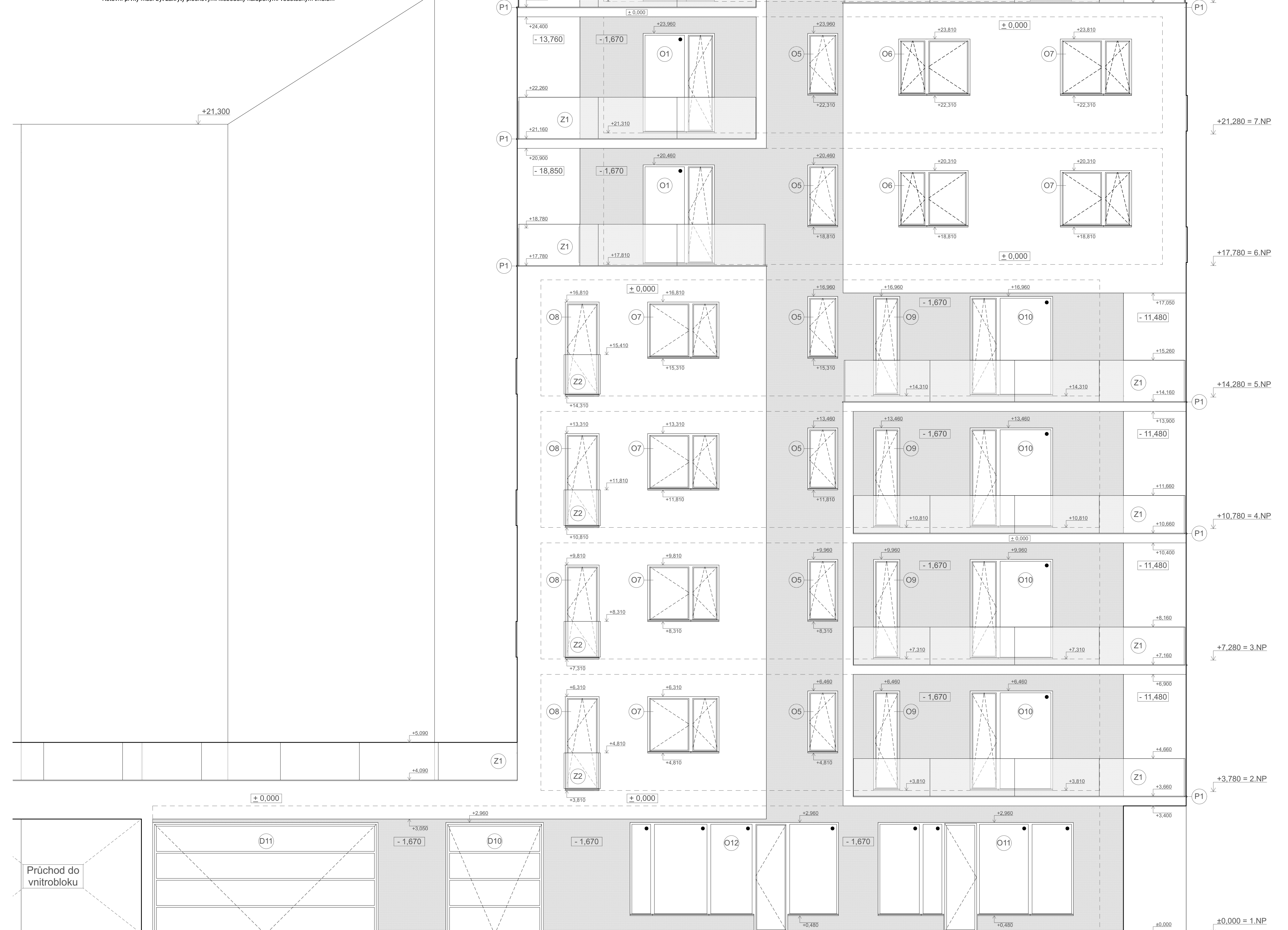
Pohled Severní M1:50