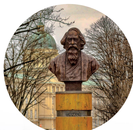
busta Rabindranáth Thákura