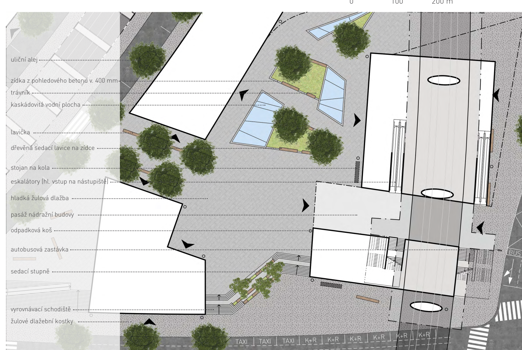
Detail řešení parteru - přednádražní prostor 0 10 20 m M1:500