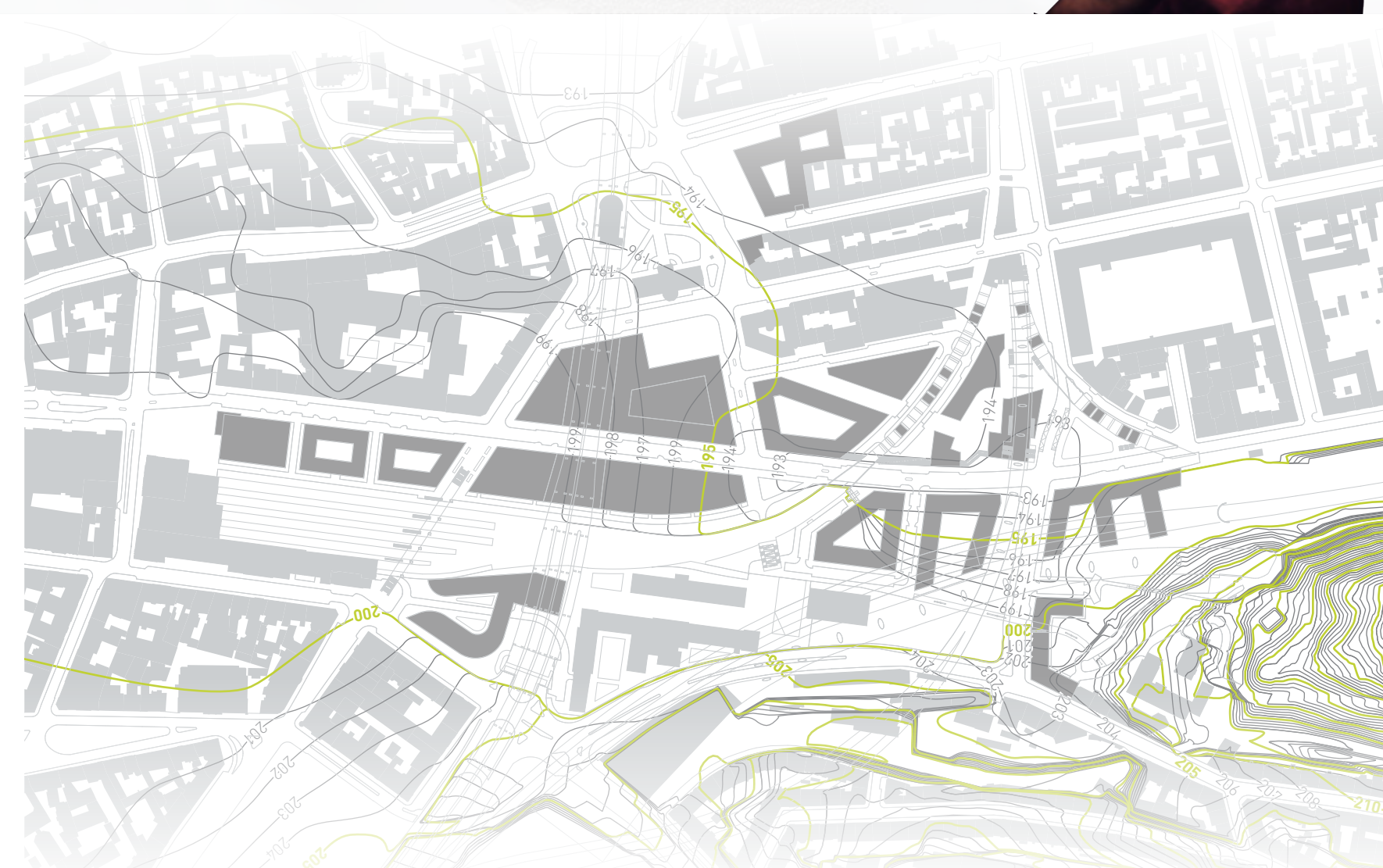
Vrstevnice (upravený terén) 0 100 200 m M1:5000