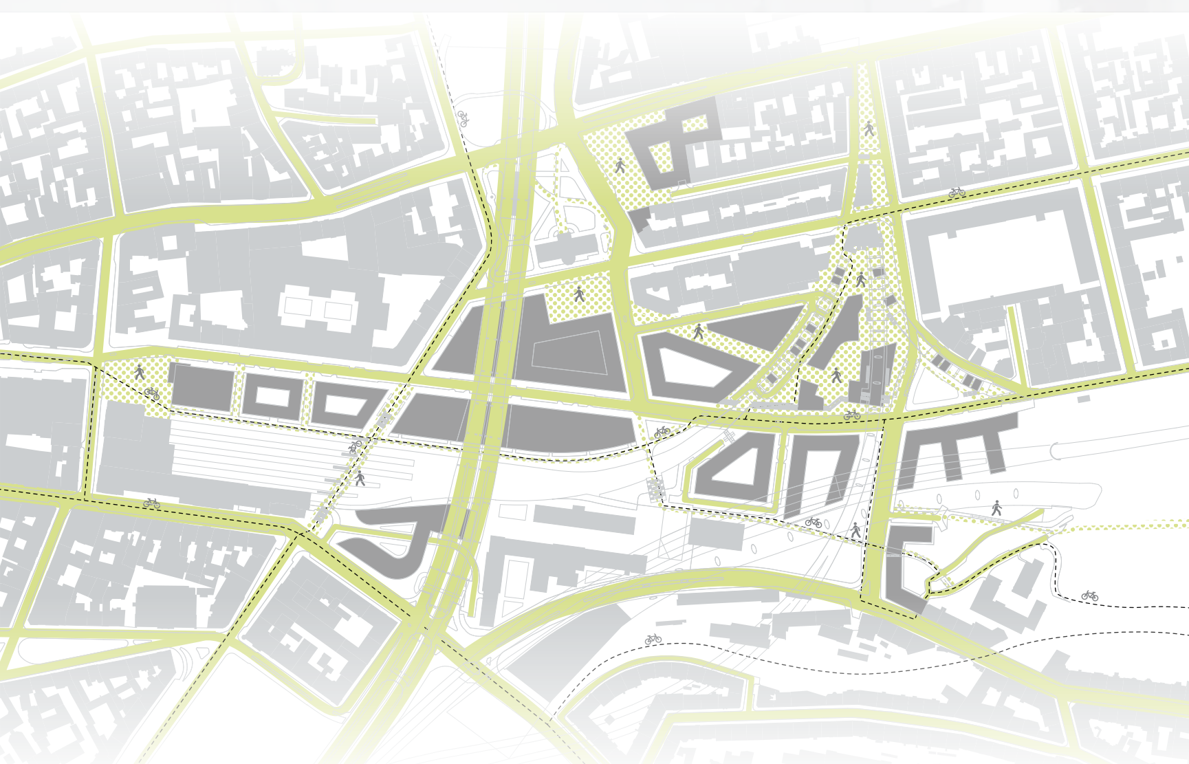
Dopravní řešení (hl. komunikace, pěší a cyklistické trasy) 0 100 200 m M1:5000