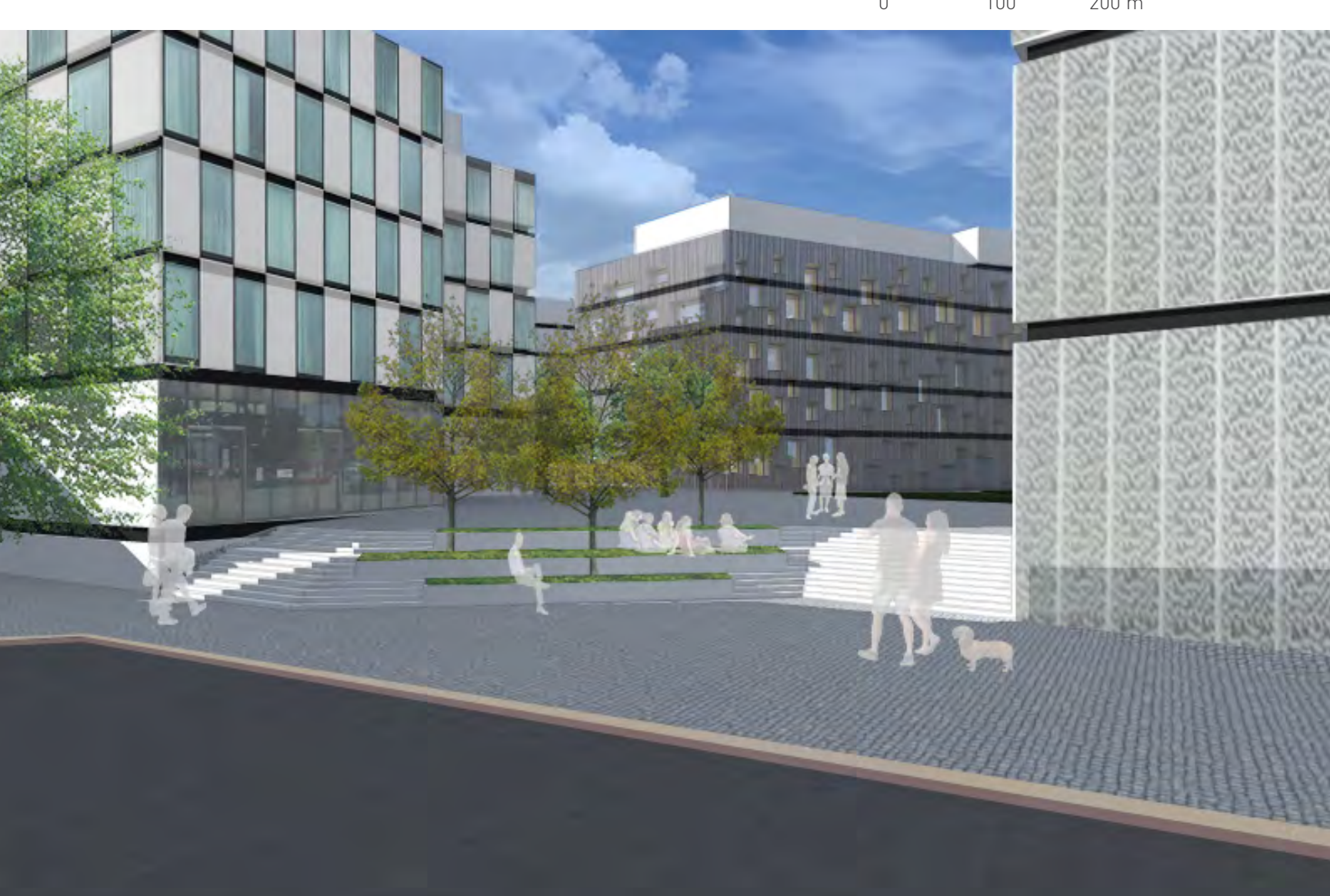
Řešení parteru - schodiště u nádraží (křižovatka ulic Na Florenci a Prvního pluku)