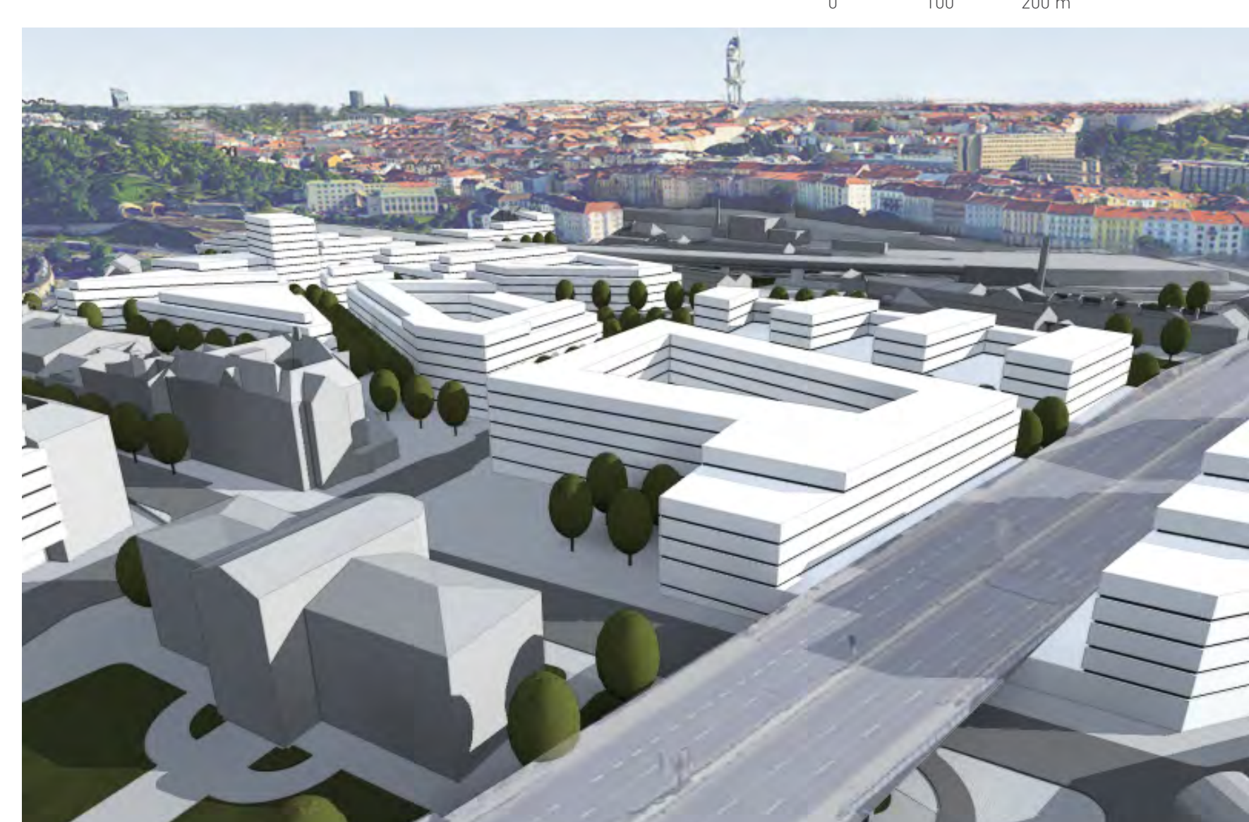
Nadhledová perspektiva - Muzeum hl. m. Prahy a budova autobusového nádraží