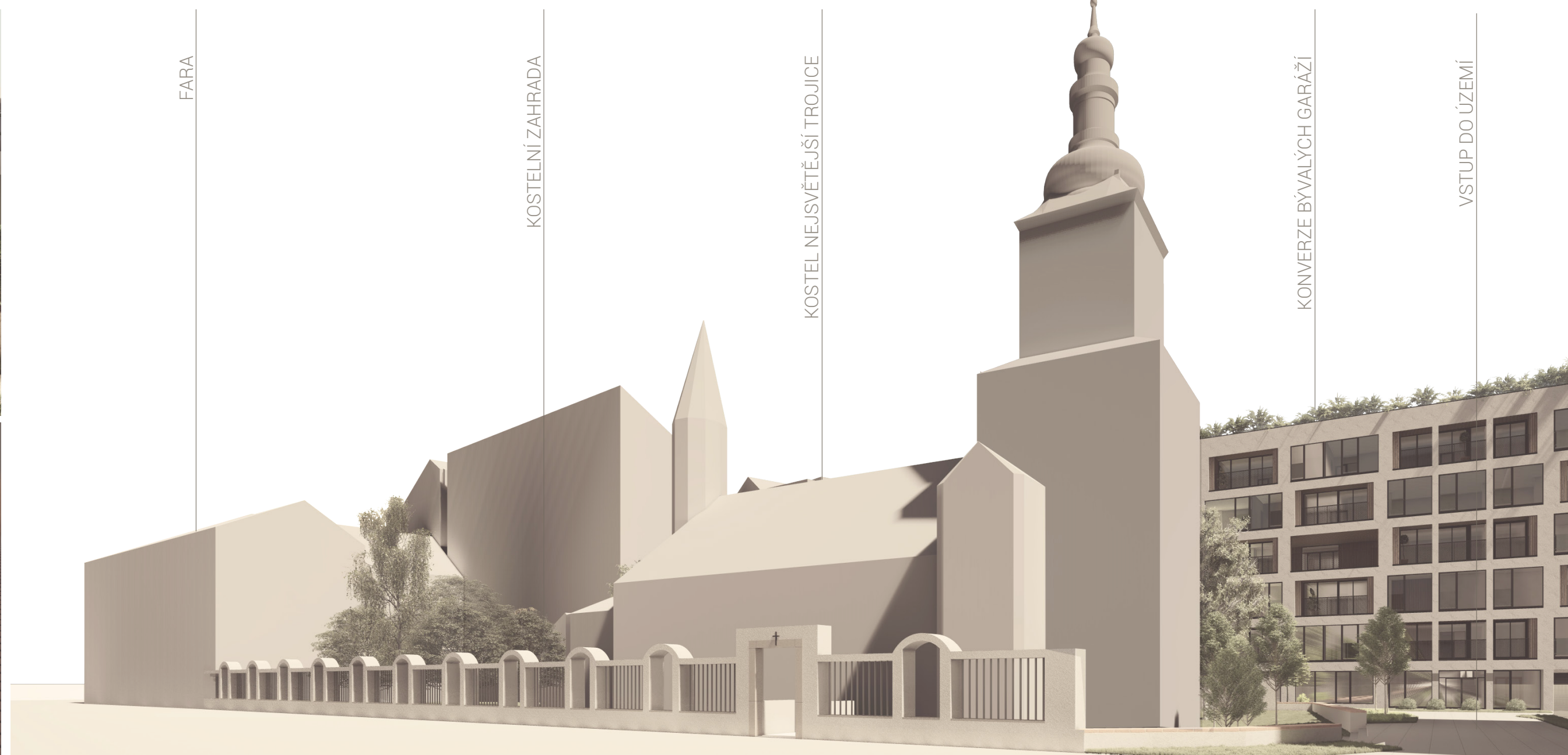
| KOSTELNÍ ZEĎ | SEVER