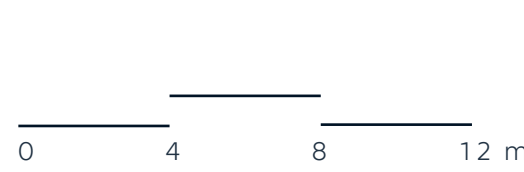
0 4 8 12 m