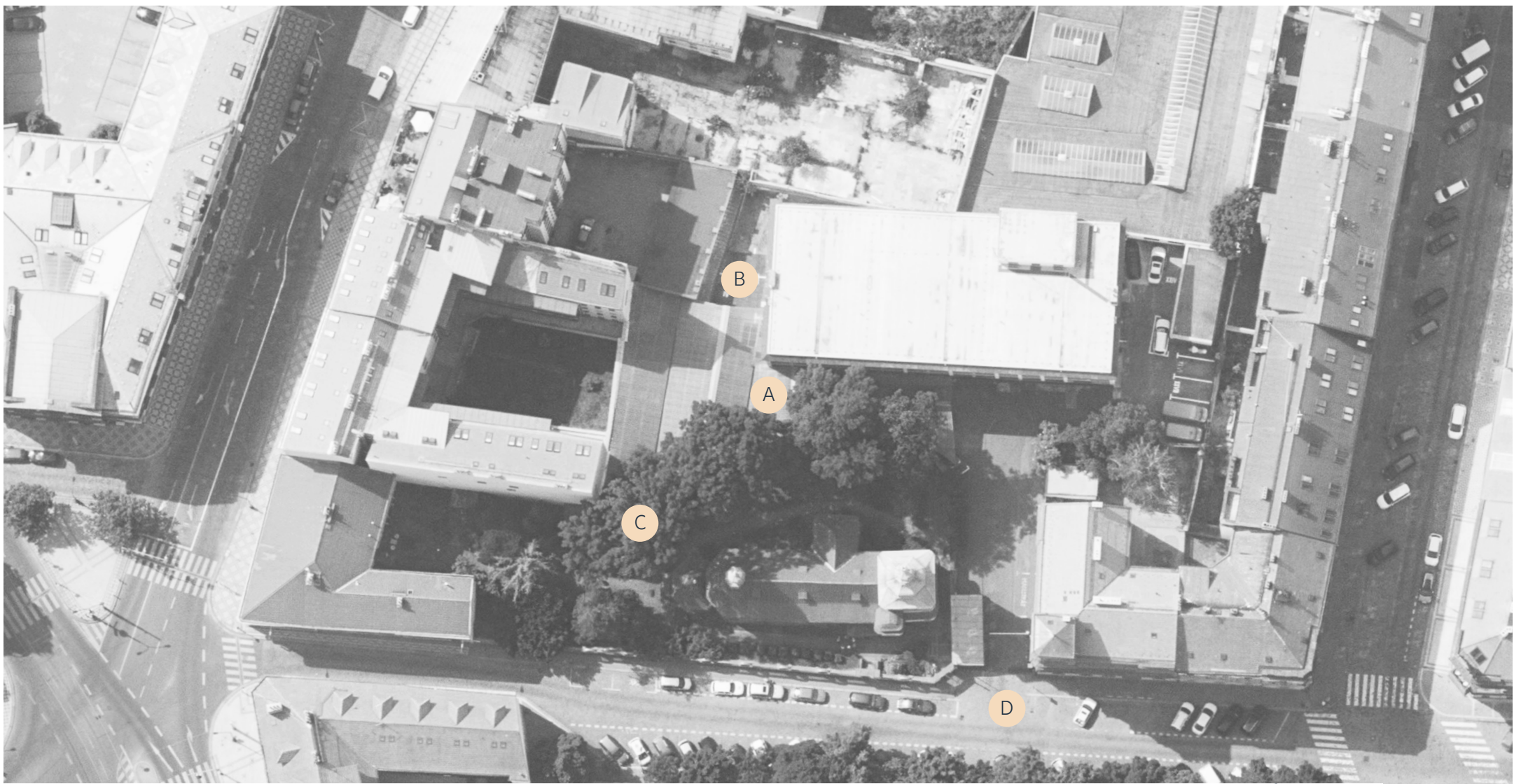
FOTODOKUMENTACE SOUČASNÉHO STAVU