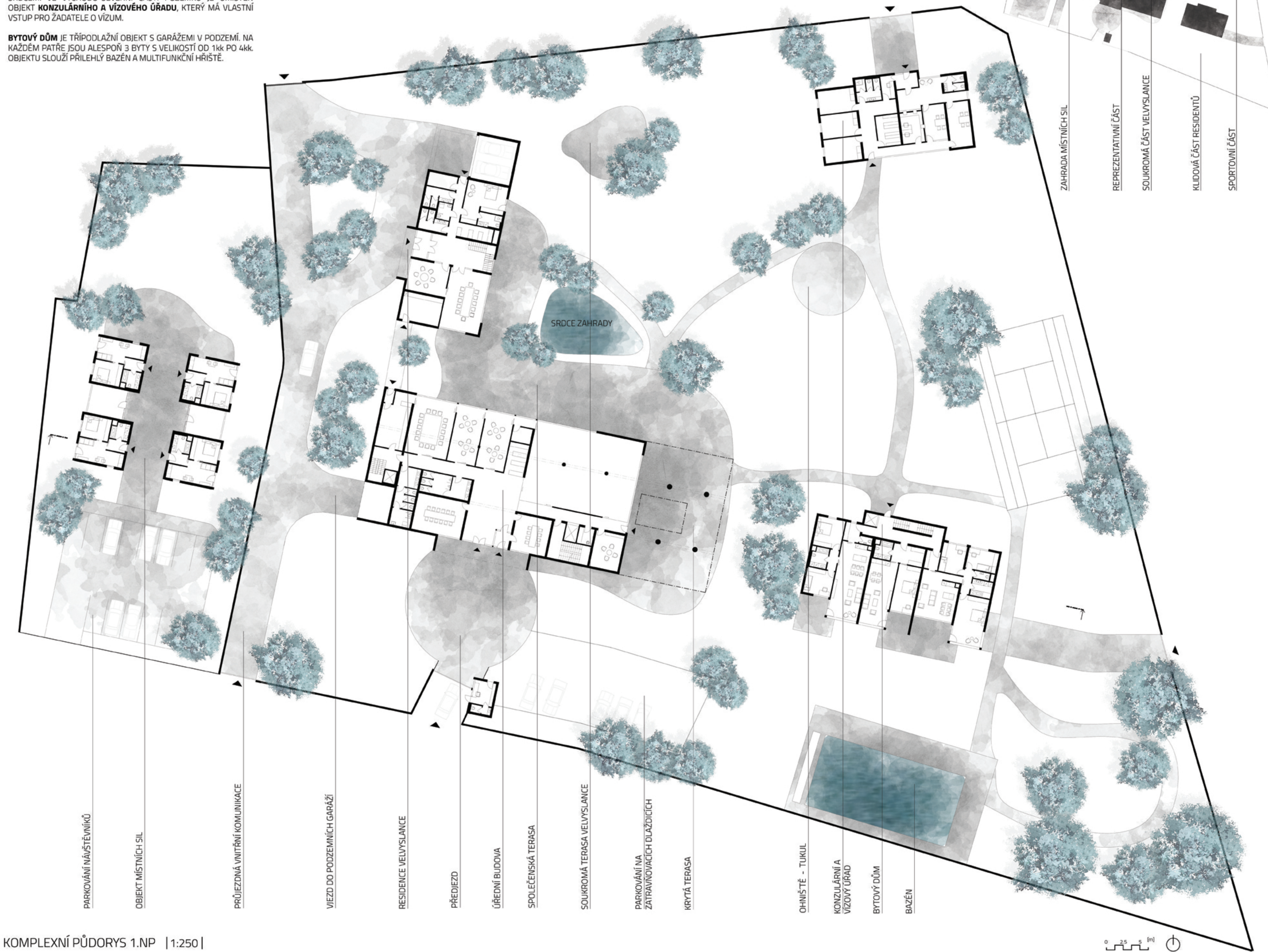
KOMPLEXNÍ PŮDORYS 1.NP | 1:250 |