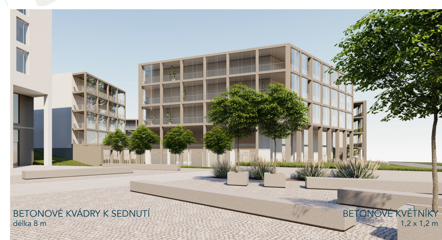
VELKOFORMÁTOVÁ BETONOVÁ DLAŽBA