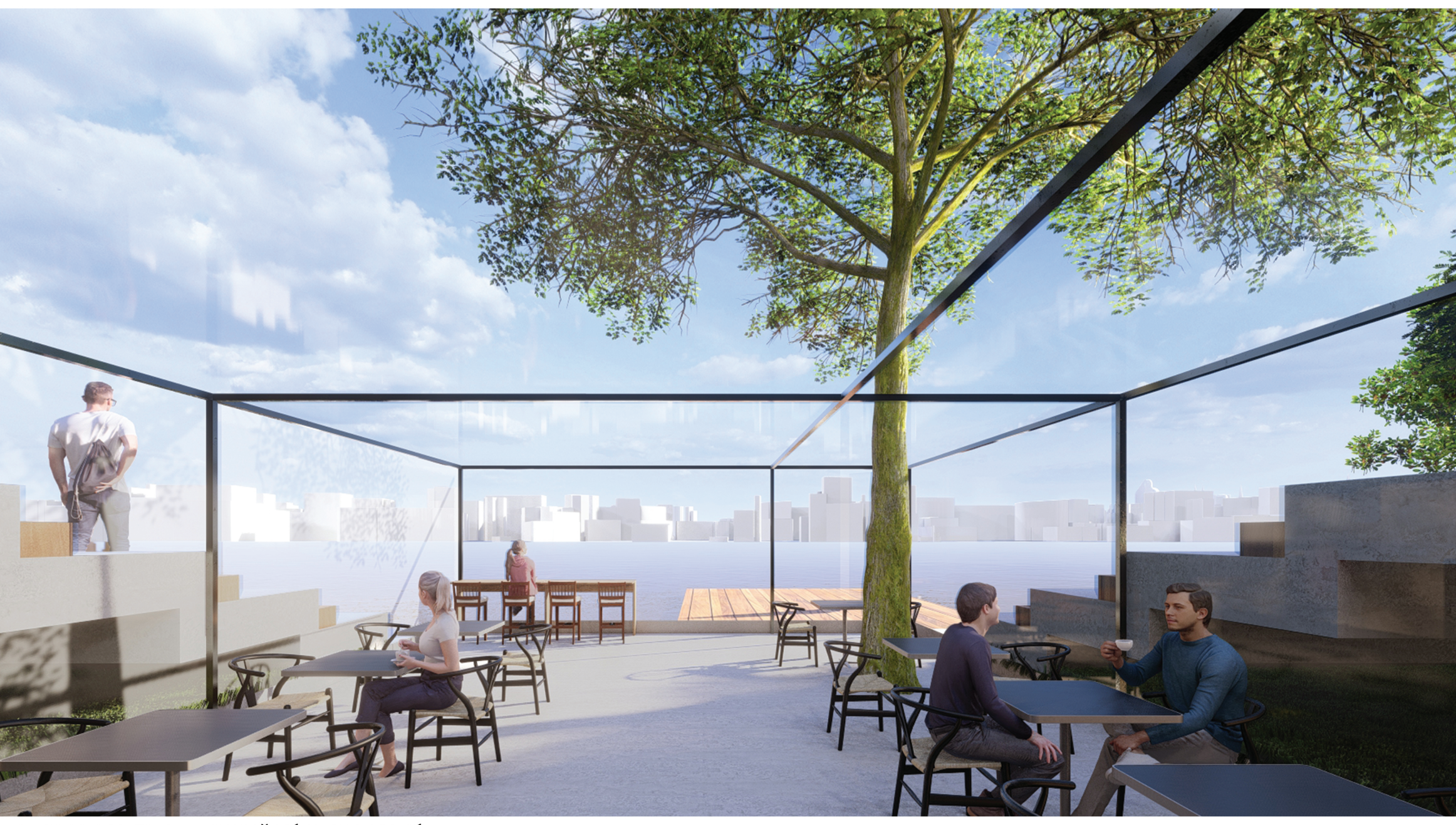
PERSPEKTIVA - VNITŘNÍ POSEZENÍ