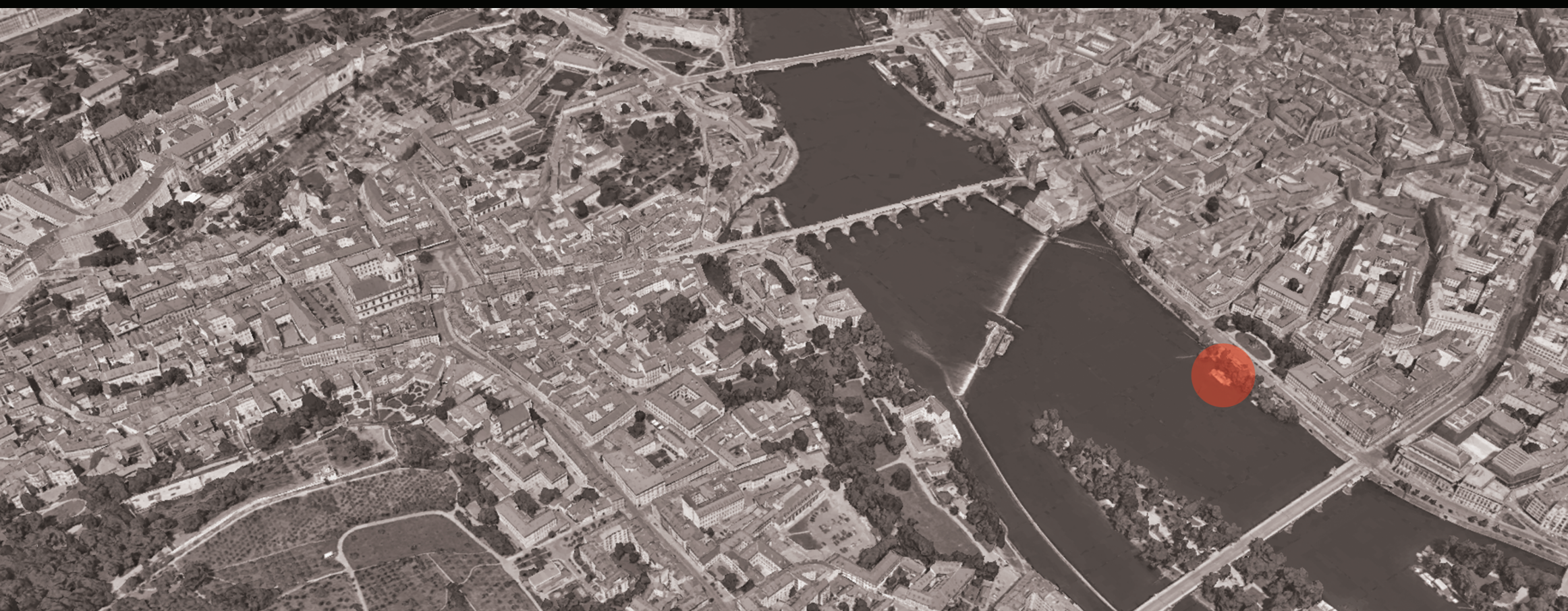
SITUACE ŠIRŠÍCH VZTAHŮ 1:10 000

LUKÁŠ TROJÁČEK ATELIÉR- VANĚK/DVOŘÁK ATZ1- LETNÍ SEMESTR 22/23