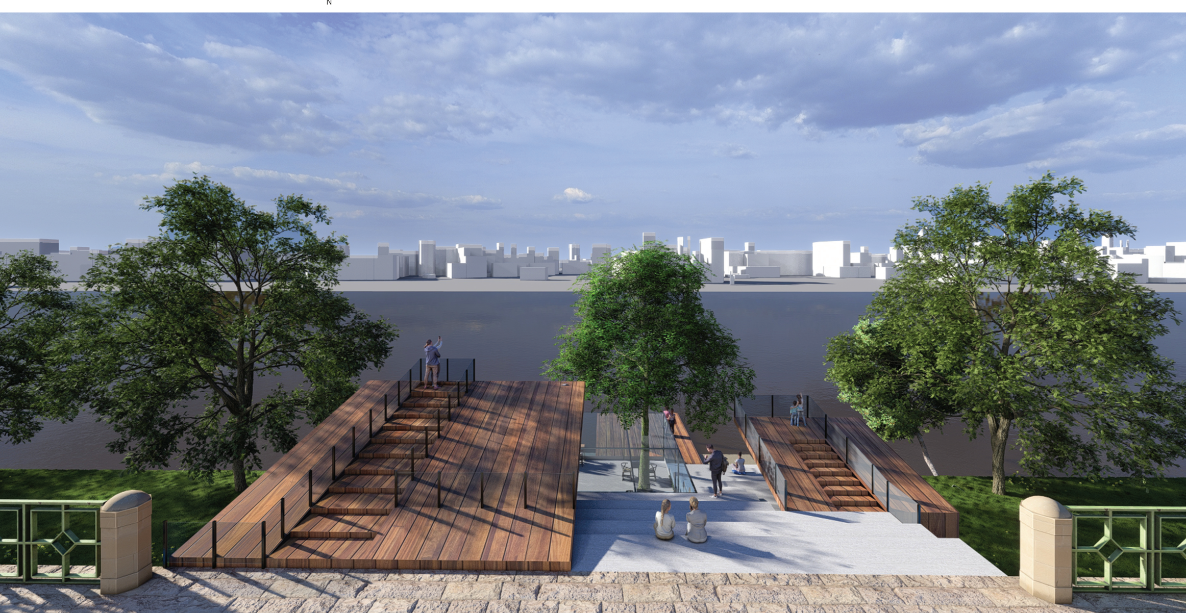
PERSPEKTIVA - NADHLED