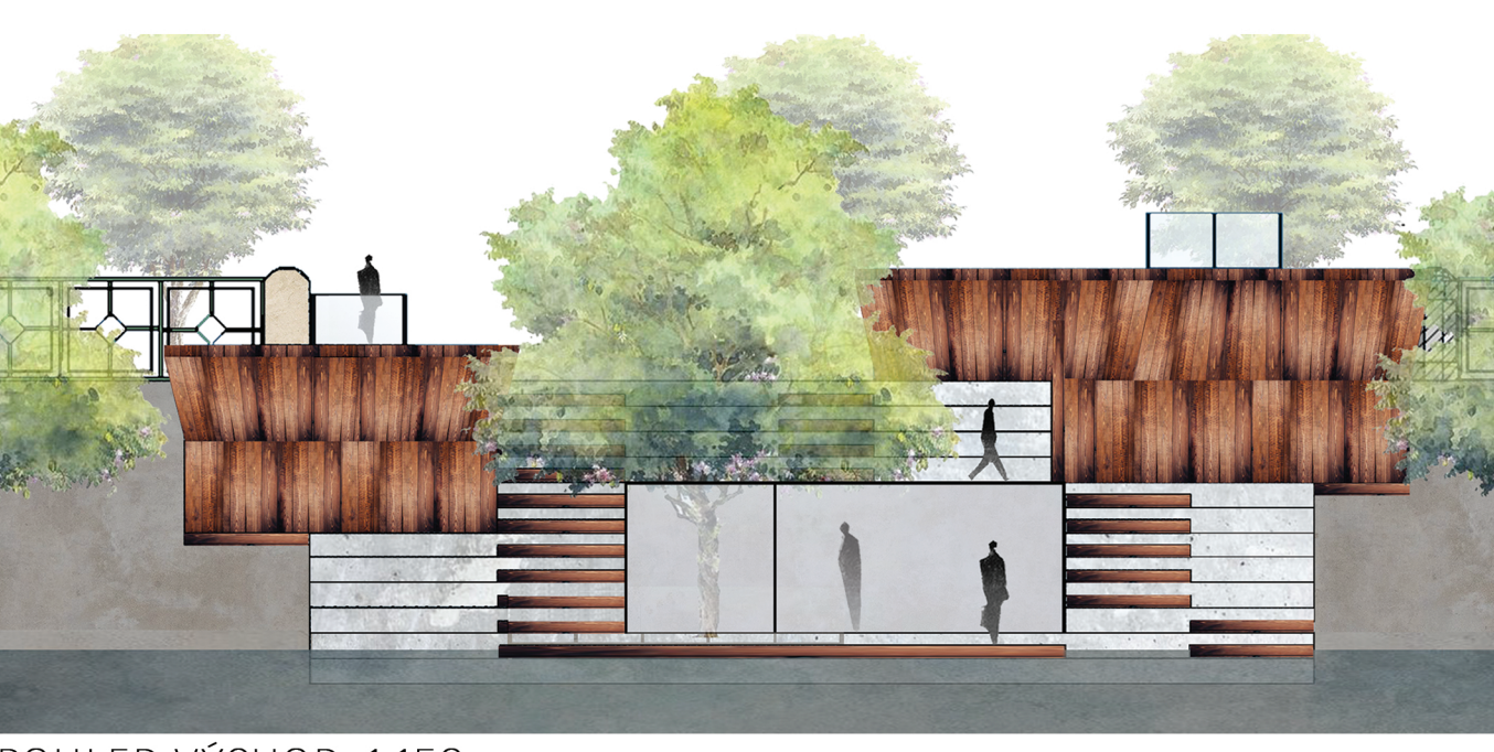
POHLED VÝCHOD 1:150