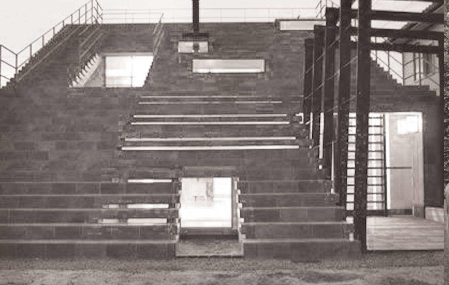
Y+M DESIGN STUDIO JAPAN