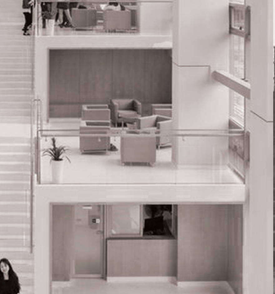
UNIVERSITY SCHOOL OF LAW PEKING

SAMOTNÝ BALKÓN JE TAKOVOU VYHLÍDKOU., SLOUŽÍCÍ K POSEZENÍ A POZOROVÁNÍ OKOLNÍHO PANORAMATU. TVAROVÉ ROZLOŽENÍ SLOUŽÍ, JAKO PROSTOR PRO SCHROMÁŽDĚNÍ LIDÍ.