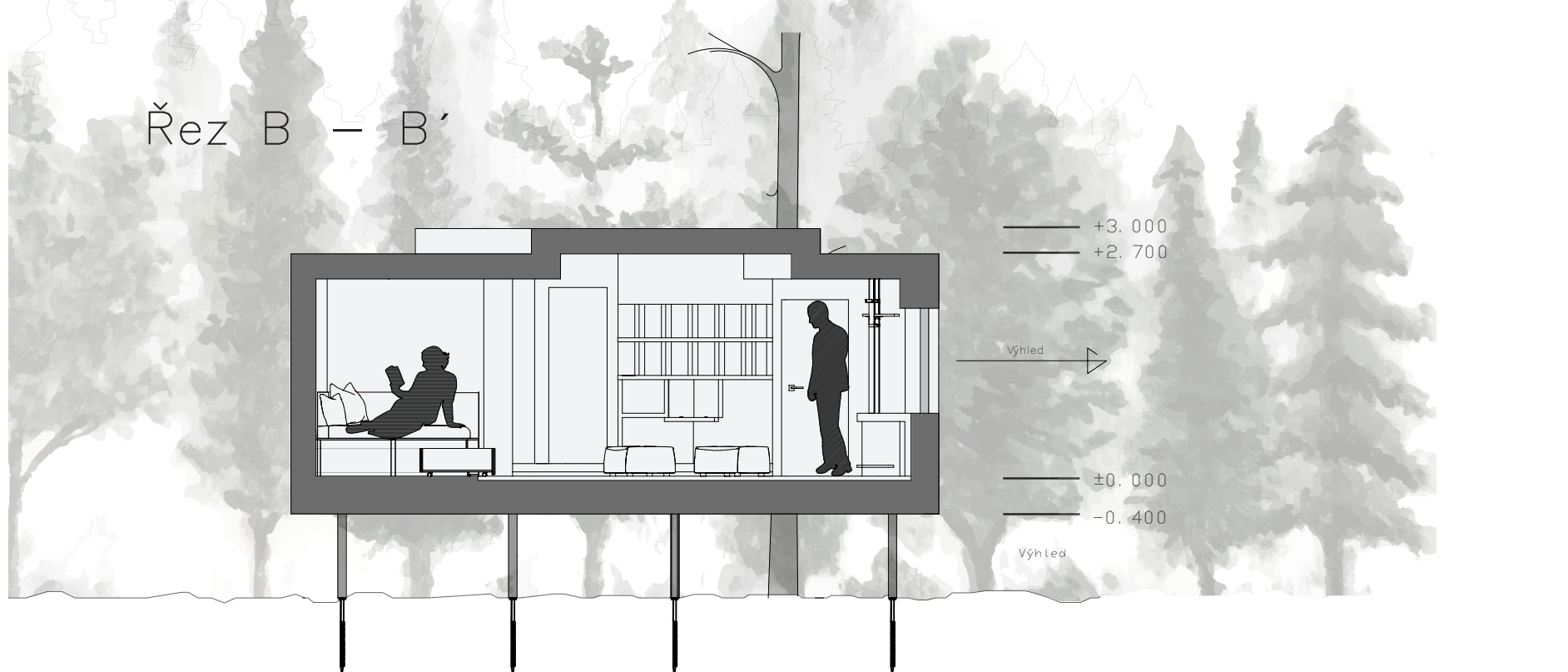
Řez B – B'