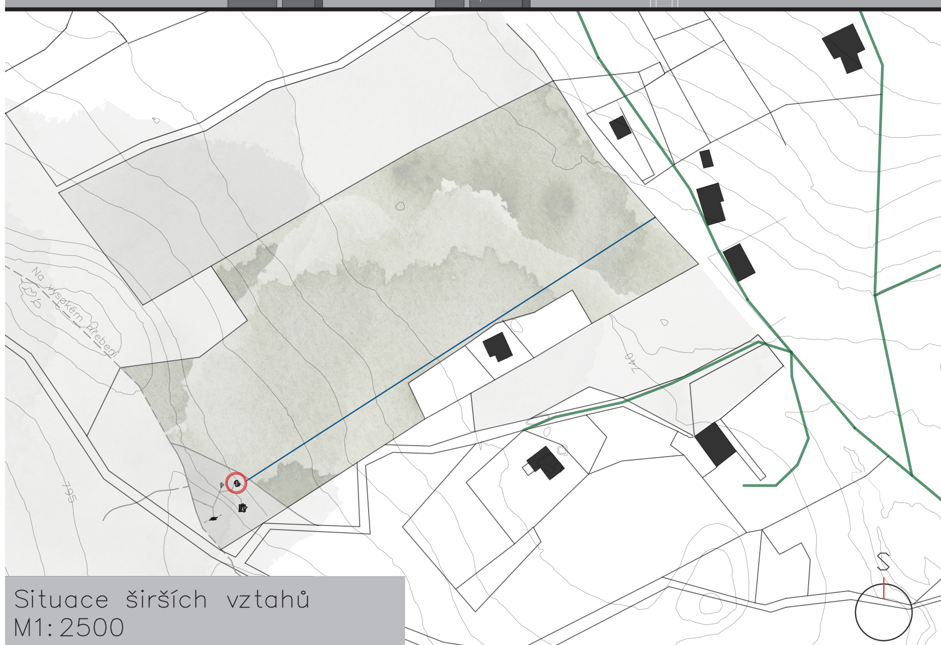
Situace širších vztahů M1:2500

CÍLEM TOHOTO PROJEKTU BYLO NAVRHNOUT OBJEKT PRO TRÁVENÍ ČASU NA POZEMKU POBLÍŽ BEDŘICHOVA U JABLONCE NAD NISOU. NAVRŽENÉ OBJEKTY NA POZEMKU BY MĚLY SLOUŽIT K RELAXACI, ODREAGOVÁNÍ A KRÁTKODOBÉMU POBYTU. OBJEKTY BY MĚLY BÝT LEHCE DEMONTOVATELNÉ A NEMĚLY BY PŘÍLIŠ ZASAHOVAT DO PŘÍRODNÍHO PROSTŘEDÍ. NAVRHOVANÝ OBJEKT JE SITUOVÁN VE VÝCHODNÍ ČÁSTI POZEMKU. TOTO UMÍSTĚNÍ BYLO ZVOLENO Z DŮVODU MOŽNOSTI VÝHLEDU SKRZ PROSTUP VYTVOŘENÝM, DNES JIŽ ZCHÁTRALOU, LANOVKOU. OBJEKT DÍKY KOMBINACI ZREZIVĚLÉHO CORTENU A ČERNÉHO VÁLCOVANÉHO PLECHU NABÝVÁ VZHLEDU OBJEKTU, KTERÝ SE NA POZEMKU NACHÁZÍ "ODJAKŽIVA". INTERIÉR MAXIMÁLNĚ VYUŽIVÁ MALÉ ROZMĚRY OBJEKTU A NABÍZÍ KLIDNÝ VÝHLED DO ODOLU BEDŘICHOVA.