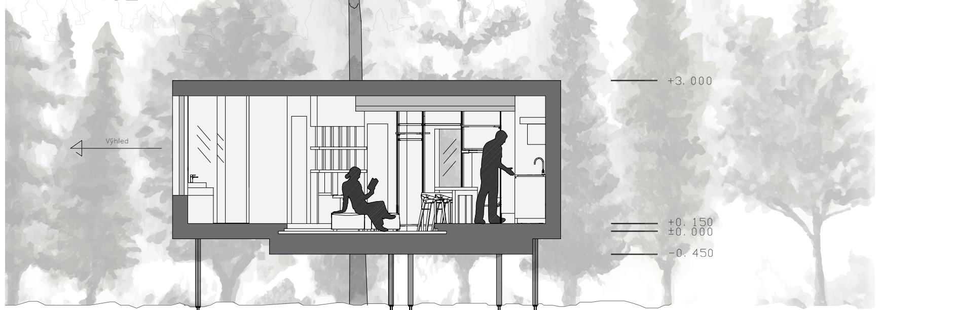
Řez A – A'