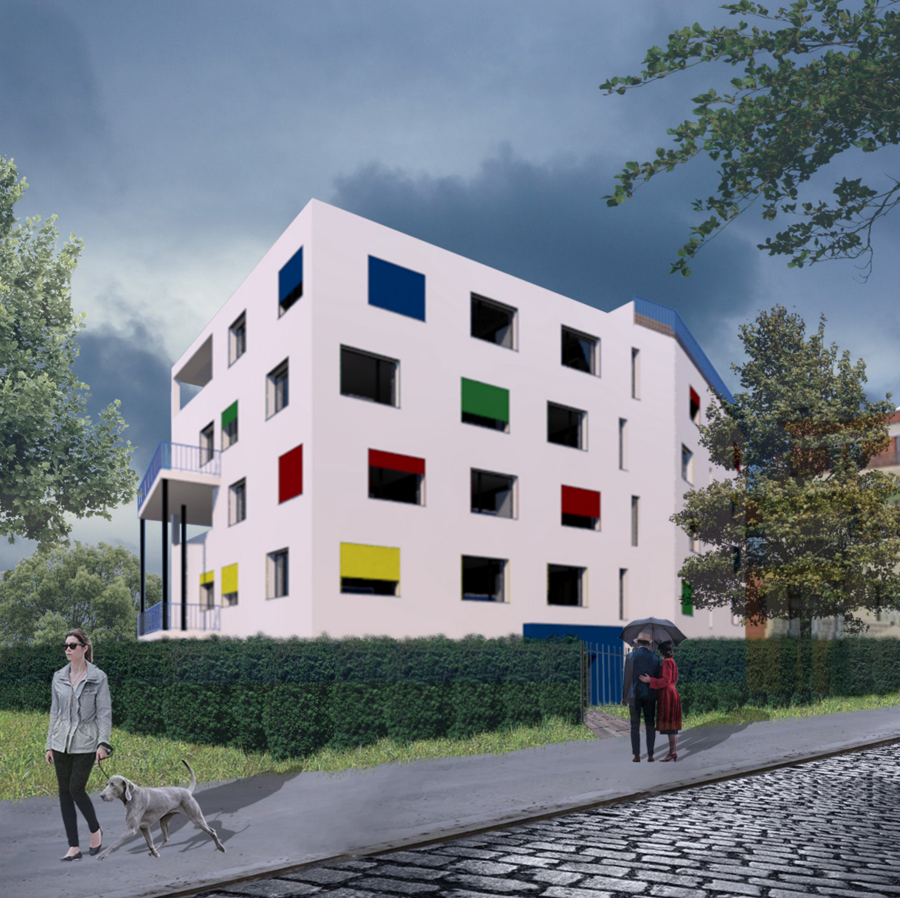
BYTOVÝ DŮM - ROOSEVELTOVA, PRAHA 6